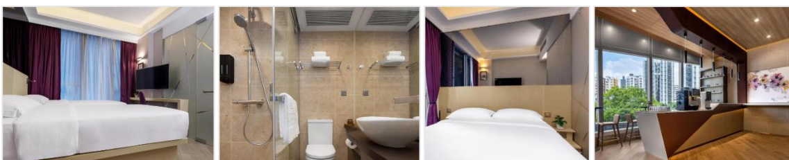
ห้องขนาด 13 ตร.ม.

วันที่ 1, 5-8, 12-15, 19-21, 26-28 เมษายน และ 1-2 พฤษภาคม จะต้องจ่ายเพิ่มท่านละ 500 บาท/คน/คืน