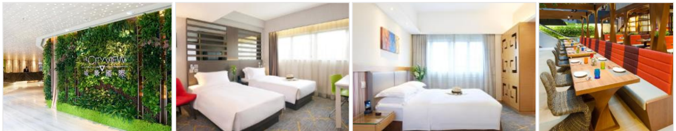
ห้องขนาด 15 ตร.ม.