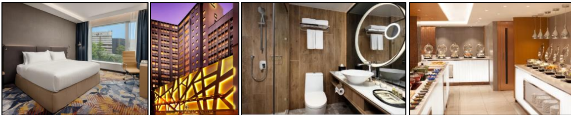
ห้องขนาด 28 ตร.ม.