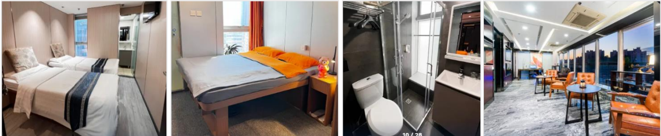
ห้องขนาด 9-12 ตร.ม.

วันที่ 27-29 พฤษภาคม และ 19-22 มิถุนายน 67 จะต้องจ่ายเพิ่มท่านละ 600 บาท/คน/คืน