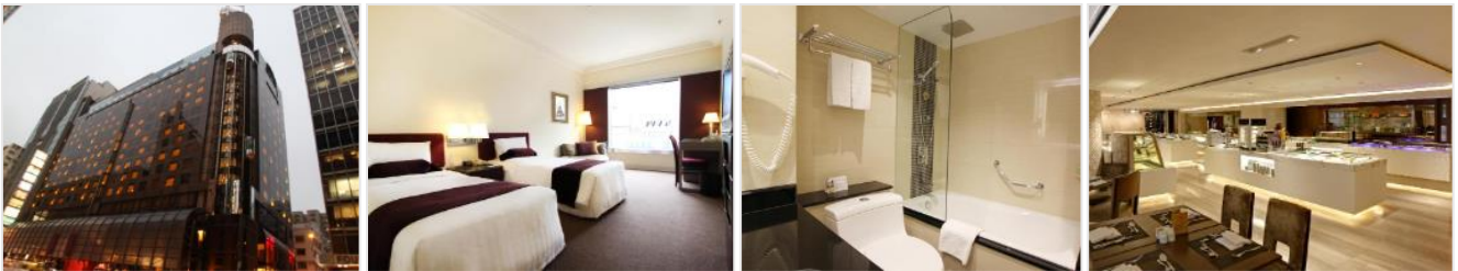
ห้องขนาด 22 ตร.ม.

วันที่ 12-14, 26-28 เมษายน 67 จะต้องจ่ายเพิ่มท่านละ 900 บาท/คน/คืน