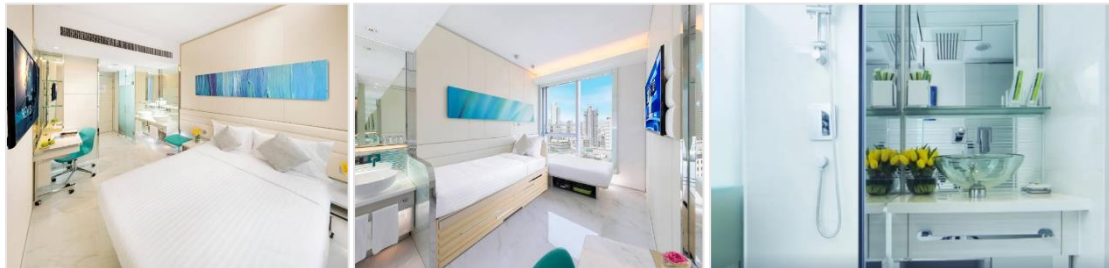
ห้องขนาด 16 ตร.ม.