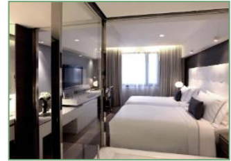
ห้อง CITY ROOM ขนาด 27 ตร.ม.