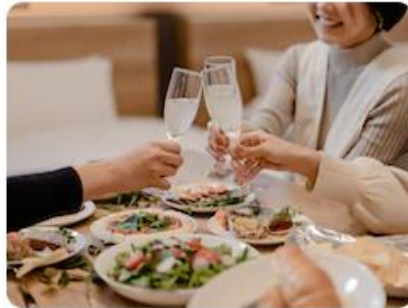
A Girl's Night at MIMARU

#longtermstay #family #tokyo #kyoto #osaka