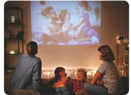
A Hotel Room with a Projector

#girlsday #friends #in-room #tokyo #kyoto