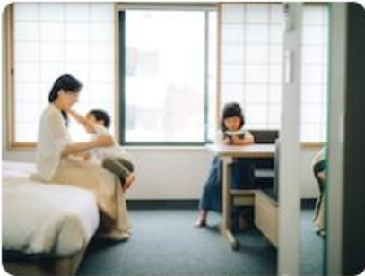
Hotel Living: Weekly/Monthly Plan

หากต้องการห้องพัก POKEMON ROOM สามารถให้ทางบริษัทเสนอให้ได้เช่นกัน