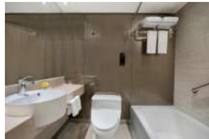
ห้องขนาด 18 ตร.ม.