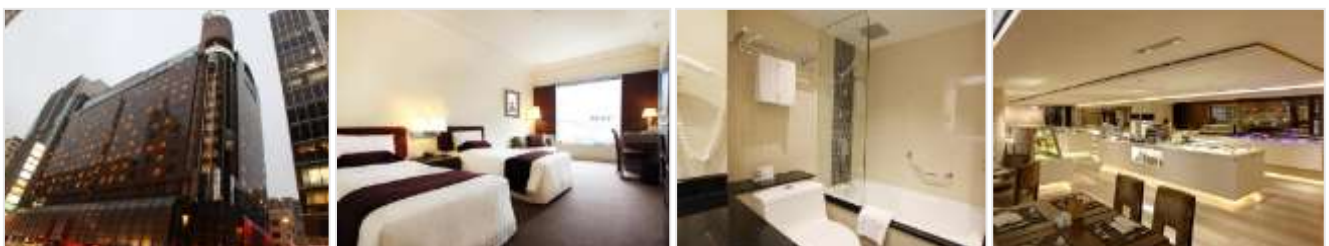
ห้องขนาด 22 ตร.ม.