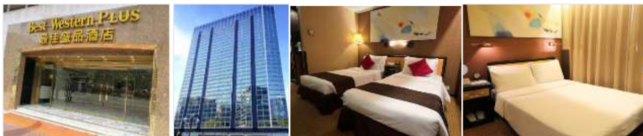
ห้องขนาด 15 ตร.ม.