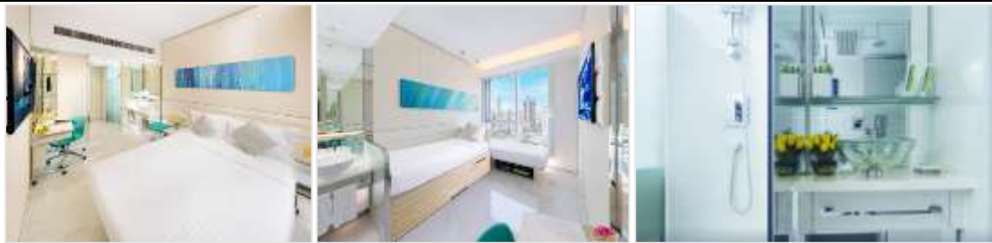
ห้องขนาด 16 ตร.ม.