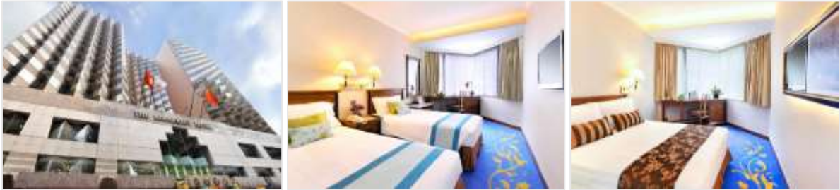
ห้องขนาด 20 ตร.ม.