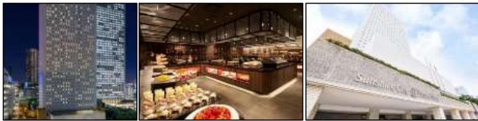
ห้อง Standard Twin ขนาดห้อง 20.7 ตารางเมตร

**ขอเพียงแค่จองกับเรา รับบริการสุดพิเศษกับการวางแผนท่องเที่ยวกรุงโตเกียว ที่มีบริการแนะนำร้านอาหารหรือคาเฟ่ที่เป็นที่นิยมของคนญี่ปุ่น ซึ่งเป็นร้านที่เคยออกรายการทีวีของญี่ปุ่นมาแล้ว