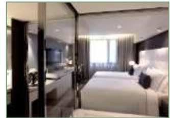
ห้อง CITY ROOM ขนาด 27 ตร.ม.

หมายเหตุ : รายการทัวร์สามารถเปลี่ยนแปลงได้ตามความเหมาะสม เนื่องจากสภาวะอากาศ, การเมือง, สายการบิน เป็นต้นโดยบริษัทฯจะคำนึงถึงความสะดวกและปลอดภัยของผู้เดินทางเป็นสำคัญ